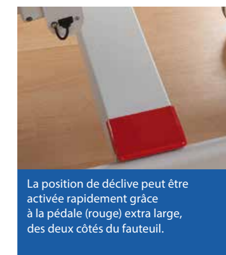
La position de déclive peut être activée rapidement grâce à la pédale (rouge) extra large, des deux côtés du fauteuil.