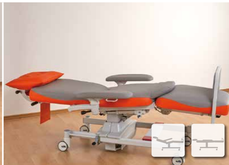
Pour une relaxation optimale, le ComfortLine2 offre un réglage indépendant de toutes les positions.