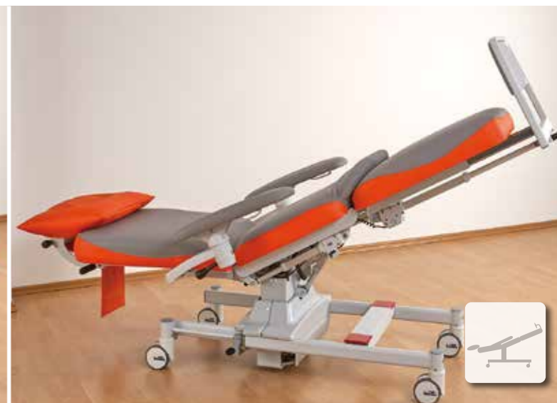
La pédale extra-large active la position de déclive, permettant ainsi d'agir les mains libres.

Le ComfortLine2 combine les dernières normes en matière d'hygiène avec l'expérience et les propriétés techniques reconnues.