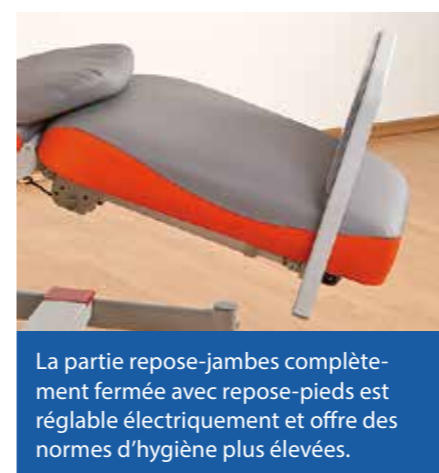
La partie repose-jambes complètement fermée avec repose-pieds est réglable électriquement et offre des normes d'hygiène plus élevées.