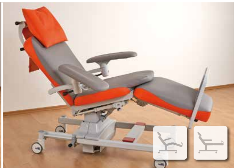
L'accoudoir peut être ajusté à la position désirée et même tourné complètement avec le levier de réglage.