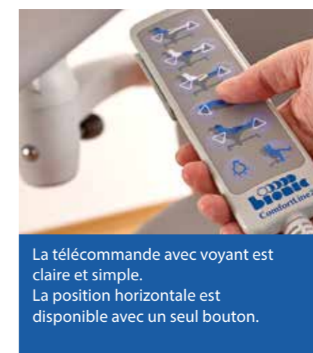
La télécommande avec voyant est claire et simple. La position horizontale est disponible avec un seul bouton.