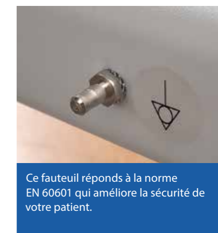
Ce fauteuil réponds à la norme EN 60601 qui améliore la sécurité de votre patient.