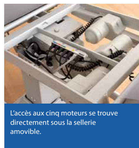
L'accès aux cinq moteurs se trouve directement sous la sellerie amovible.