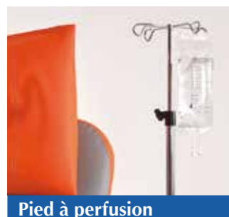
Pied à perfusion