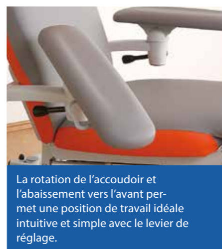
La rotation de l'accoudoir et l'abaissement vers l'avant permet une position de travail idéale intuitive et simple avec le levier de réglage.