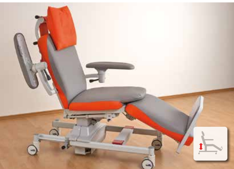
La position d'entrée et de sortie est activée avec un bouton préprogrammé.