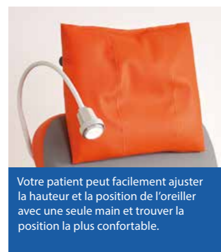
Votre patient peut facilement ajuster la hauteur et la position de l'oreiller avec une seule main et trouver la position la plus confortable.