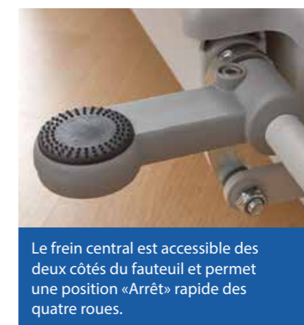
Le frein central est accessible des deux côtés du fauteuil et permet une position «Arrêt» rapide des quatre roues.